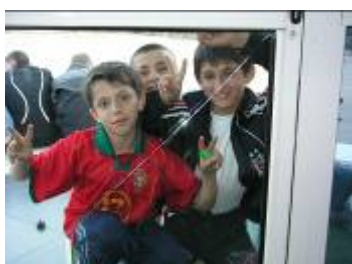
Ragazzi in attesa di entrare all'Oratorio

Si meravigliano che persone adulte possono entrare così facilmente in relazione con loro